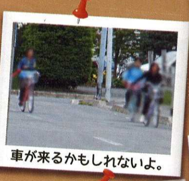
車が来るかもしれないよ。