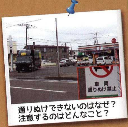
通りぬけできないのはなぜ？ 注意するのはどんなこと？