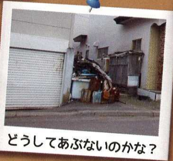
どうしてあぶないのかな？