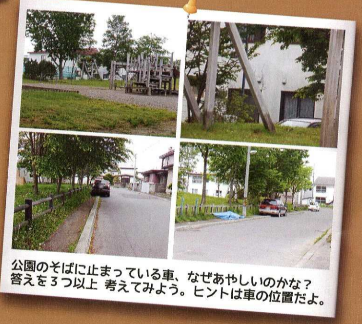
公園のそばに止まっている車、なぜあやしいのかな？ 答えを3つ以上 考えてみよう。ヒントは車の位置だよ。