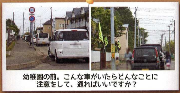
幼稚園の前。こんな車がいたらどんなことに 注意をして、通ればいいですか？