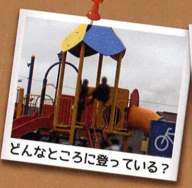
どんなところに登っている？