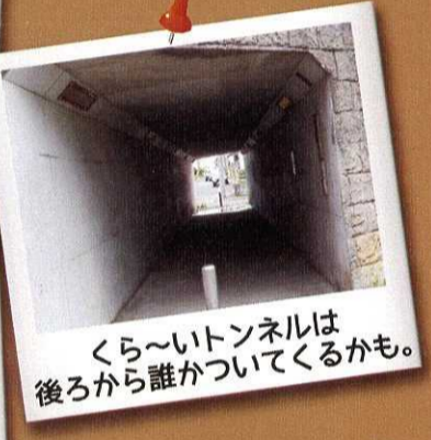
くら〜いトンネルは 後ろから誰かついてくるかも。