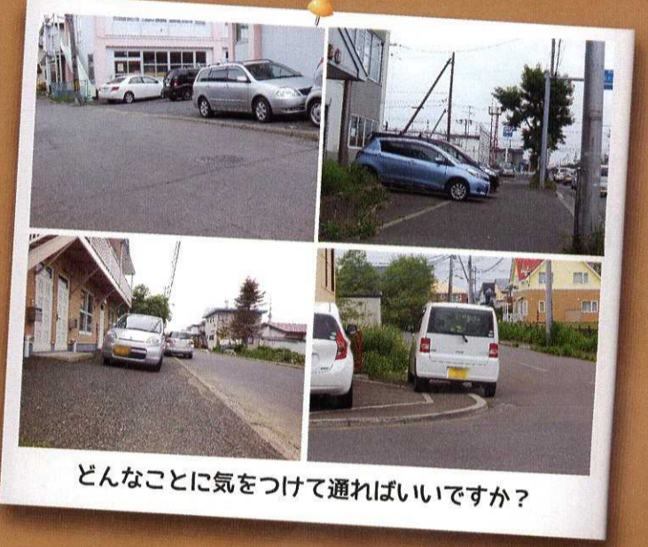
どんなことに気をつけて通ればいいですか？