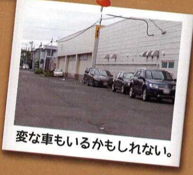
変な車もいるかもしれない。