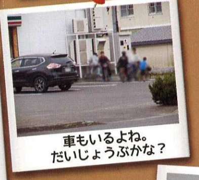
車もいるよね。 だいじょうぶかな？