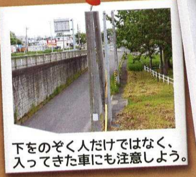
下をのぞく人だけではなく、 入ってきた車にも注意しよう。