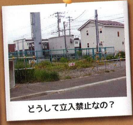
どうして立入禁止なの？