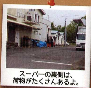
スーパーの裏側は、 荷物がたくさんあるよ。