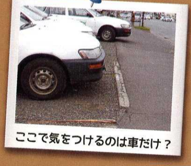
ここで気をつけるのは車だけ？