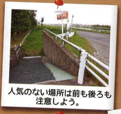
人気のない場所は前も後ろも 注意しよう。