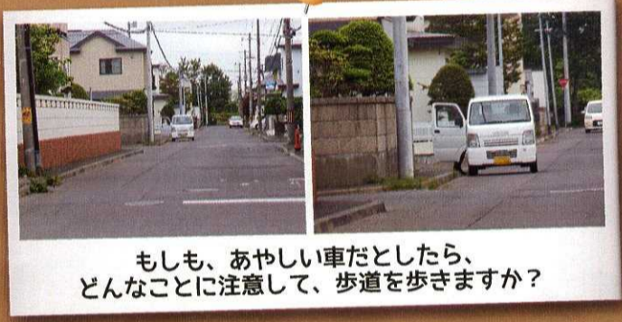
もしも、あやしい車だとしたら、 どんなことに注意して、歩道を歩きますか？