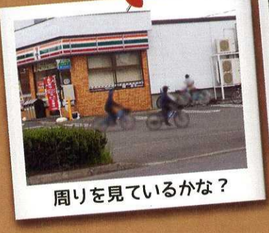
周りを見ているかな？