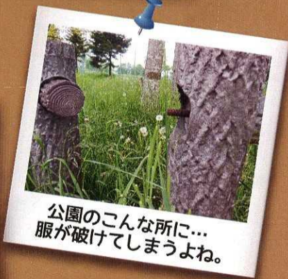
公園のこんな所に... 服が破けてしまうよね。