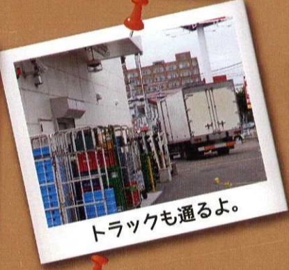
トラックも通るよ。