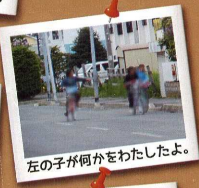
左の子が何かをわたしたよ。