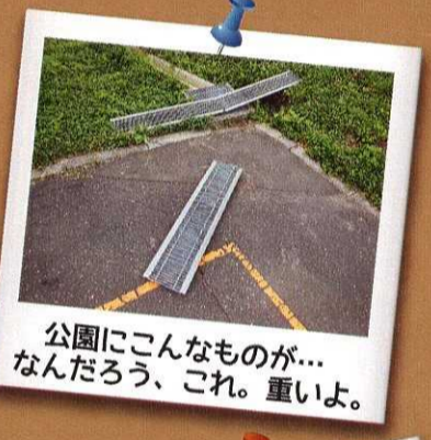
公園にこんなものが... なんだろう、これ。重いよ。