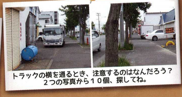
トラックの横を通るとき、注意するのはなんだろう？ 2つの写真から10個、探してね。